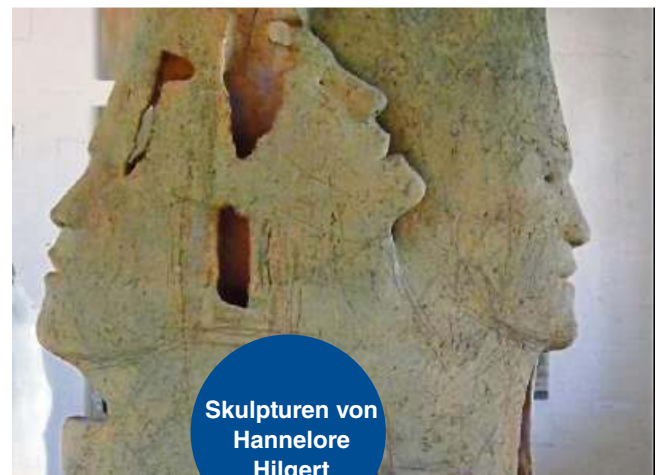
Skulpturen von Hannelore Hilgert